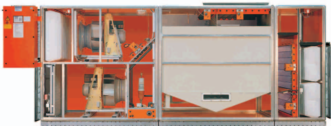
Aggregatet är extrautrustat med returluftpjäll och flexibla kanalstos

Klimatanläggning med dubbel plattvärmväxlare Verkningsgrad 0,70-0,80