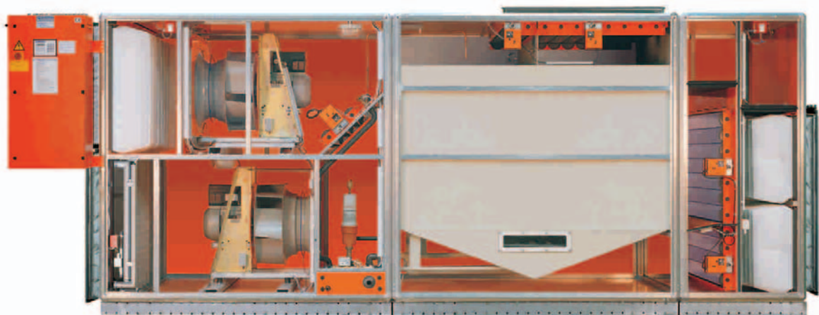
Aggregatet är extrautrustat med returluftspjäll och flexibla kanalstos

MENERGA® - Dosolair® Klimataggregat med hög verkningsgrad